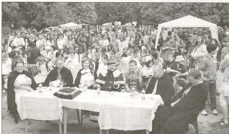
MAJÁLES 2009. Stovky studentů holešovských středních škol, ale také jejich učitelé i představitelé města se zúčastnili ve čtvrtek 14. května dopoledne zahájení Majálesu 2009. Další informace na str. 10.

Program: tradiční soutěže v parkurovém skákání různých úrovní, bohatý doprovodný program (mažoretky, skákací hrad atd.) a občerstvení.