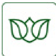
Obr. 1 Logo ČSSZ

Standardní logo ČSSZ svojí barevností a tvarem vyjadřuje serióznost a princip solidarity v sociálním systému. V grafické části loga je použit český národní motiv – lipové listy. Spojením a otevřeností symbolizují vstřícnost a sounáležitost s veřejností, pro klientský přístup ČSSZ.