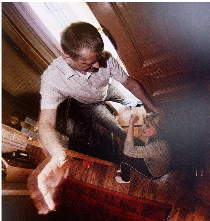
Domácí násilí v obrazech a povídkách. Sborník nejlepších žákovských prací. Praha: GAD STUDIO s.r.o., 2011.