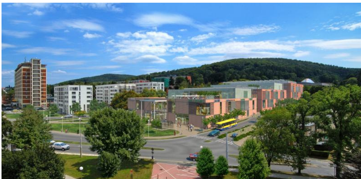
Obrázek 1 Vizualizace výstavby SOC Kaskáda Zlín

(Zahájení výstavy fotografií nového společensko-obchodního centra Zlín., 2007)