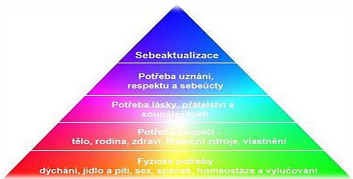
Obrázek č. 2. Abraham Maslow - Pyramida potřeb

Další z práv, které mají osoby s mentální retardací je právo na práci. Osoby s lehkou a střední mentální retardací jsou schopni se uplatnit i na pracovním trhu na chráněných pracovních místech, chráněných dílnách, pokud jsou k tomu vedeni a motivováni.