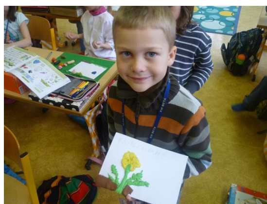
Obrázek 2: Práce s modelínou