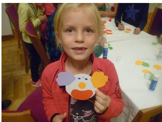
Obrázek 1: Výtvarné tvoření

Jednou ze zásad je hodnocení dítěte. Dítě by mělo být hodnoceno pozitivně, pokud prokáže určitou schopnost, vyřeší dobře příklad, doplní správně cvičení v českém jazyce apod. Dítě by mělo mít pocit, že je v něčem dobré a že se mu něco povedlo. Pokud by pedagog dítě neustále kritizoval, dítě bude mít pocit méněcennosti. Děti s ADHD se vypořádávají s kritikou hůř než ostatní děti. Proto je důležité na tento fakt nezapomínat. Dalším důležitým bodem je vhodné uspořádání ve třídě. Lavice by měly být dány maximálně po dvou a dítě s ADHD by mělo sedět, pokud je to možné vepředu. Důležitý je pro dítě s ADHD styl a rytmus výuky. Hodina by měla vždy mít určitý řád. Dítě tak ví co očekávat a je díky tomu klidnější. Těžší úkoly by mělo dítě dělat v ranních hodinách, kdy je schopno soustředit se víc. Dle Goetze (2009) je známo, že schopnost dětí s ADHD udržet pozornost během dne klesá. Pedagog by se měl vyvarovat úkolům na rychlost. Jednak v dítěti s ADHD vyvolá tímto zbrkllost a impulzivitu a v kolektivu tímto krokem vyzývá k soutěživosti mezi ostatními dětmi, kdo je lepší a kdo naopak horší. Neméně důležitou zásadou je snaha pedagoga vytvářet ve třídě dobré vztahy mezi vrstevníky. Pedagog by měl dětem vysvětlit, že každý člověk je jedinečný, každý má jiný názor a jiné vlastnosti. Je důležité, aby se děti uměly navzájem respektovat. Samozřejmě zásad, jak pracovat s dítětem s ADHD, je mnoho a záleží vždy na konkrétním jedinci. V této práci jsou popsány jen ty nejzákladnější.