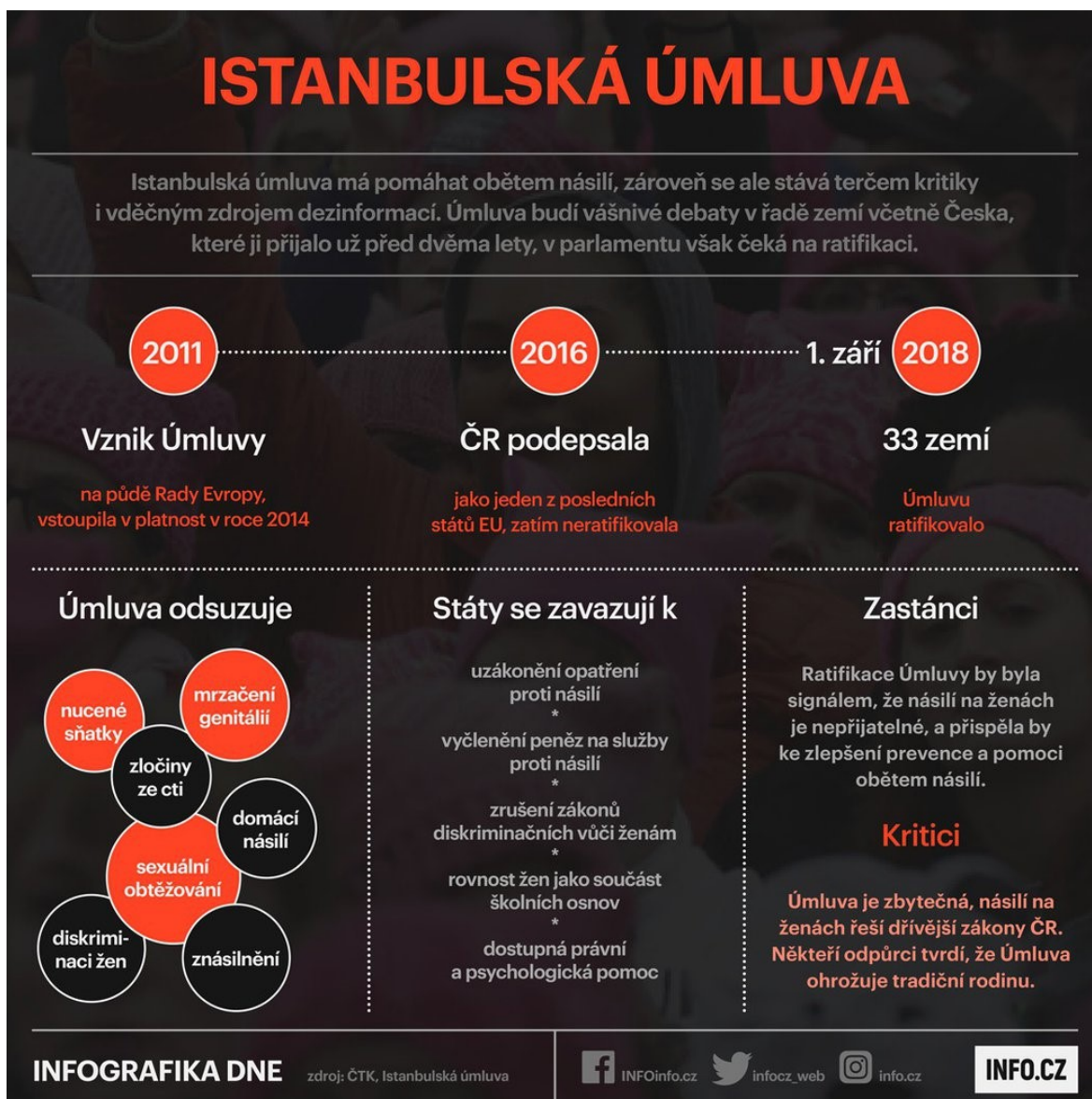
Obr. č. 4, (Istanbulská úmluva©2019)

2 Pro zajištění efektivního naplňování těchto ustanovení jednotlivými stranami, úmluva stanoví specifický monitorovací mechanismus. (Istanbulská úmluva©2019)