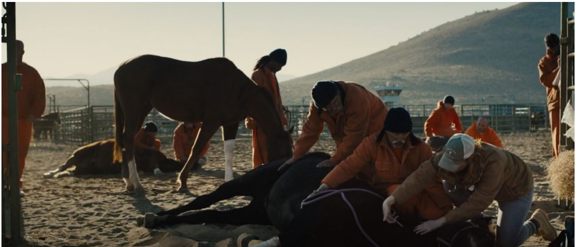
Obrázek 9 Scéna, kde ošetřují koně

Ve scéně, kdy je hlavní herec konečně schopen nasednout na koně a běhat v ohradě dokola, se o akci postaral koordinátor kaskadérů. Ve stejné scéně, kdy herec z koně spadne, předvedl základní pád z koně kaskadér. Kůň byl pro tuto akci kondičně připraven.