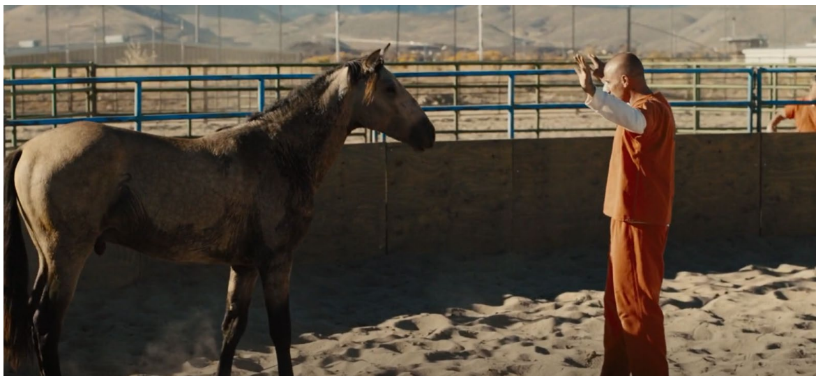
Obrázek 7 Scéna, kde hlavní herec křičí na koně

Ve scéně, kdy herec poprvé vchází do ohrady a křičí na koně, aby ustoupil, byla celá scéna postavena z panelů, které jsou bezpečné pro koně, bez ostrých hran a výstupků. Kulatá ohrada je zevnitř dále chráněna překližkovými panely. Herci v kostýmech, kteří pracovali s koněm, byli cvičitelé v kostýmech. Kůň byl trikový kůň, kterého bylo možné vizuálně navádět na dálku. Cvičitel používal polohu svého těla k tomu, aby se kůň pohyboval po ohradě. Dělal to tak, že se postavil čelem ke koni nebo šel směrem k jeho rameni a ukazoval na něj tyčí z PVC. Kůň reagoval kroužením v klusu na základě předchozího výcviku v kruhové ohradě.