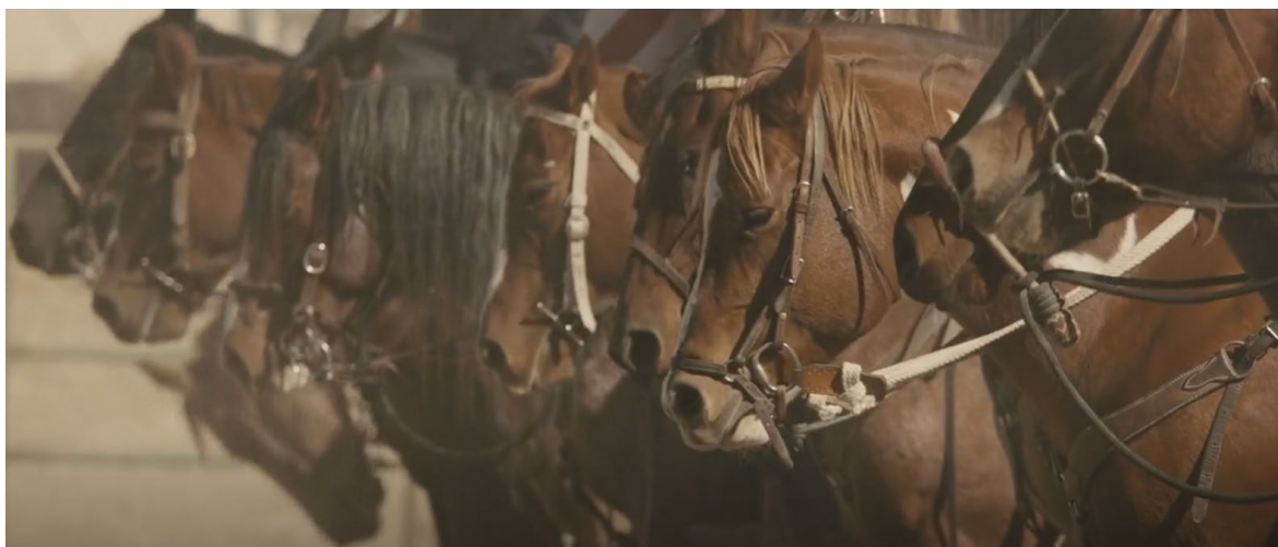
Obrázek 10 Scéna, kdy vězni přijíždí do arény

V závěru filmu, kdy herec otevře bránu a kůň vyběhne ven, se tato scéna zkoušela několikrát. Herec a kůň se v tomto okamžiku dobře znali. Cvičitel stál mimo kameru a pokynul koni, aby k němu přiběhl.