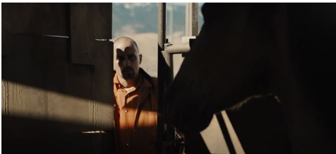
Obrázek 6 Scéna, kdy se hlavní herec blíží ke koni

Ve scéně, kdy se hlavní herec blíží ke koni v uzavřeném přívěsu, se kůň otočí zadkem směrem k herci. Kůň také kývne hlavou, sáhne tlapou na zem a ustoupí od herce. Všechny tyto akce byly vizuálně signalizovány trenérem, který v každé ruce držel dlouhý bič a různě jimi mával nebo je zvedal, aby naznačil různé akce.