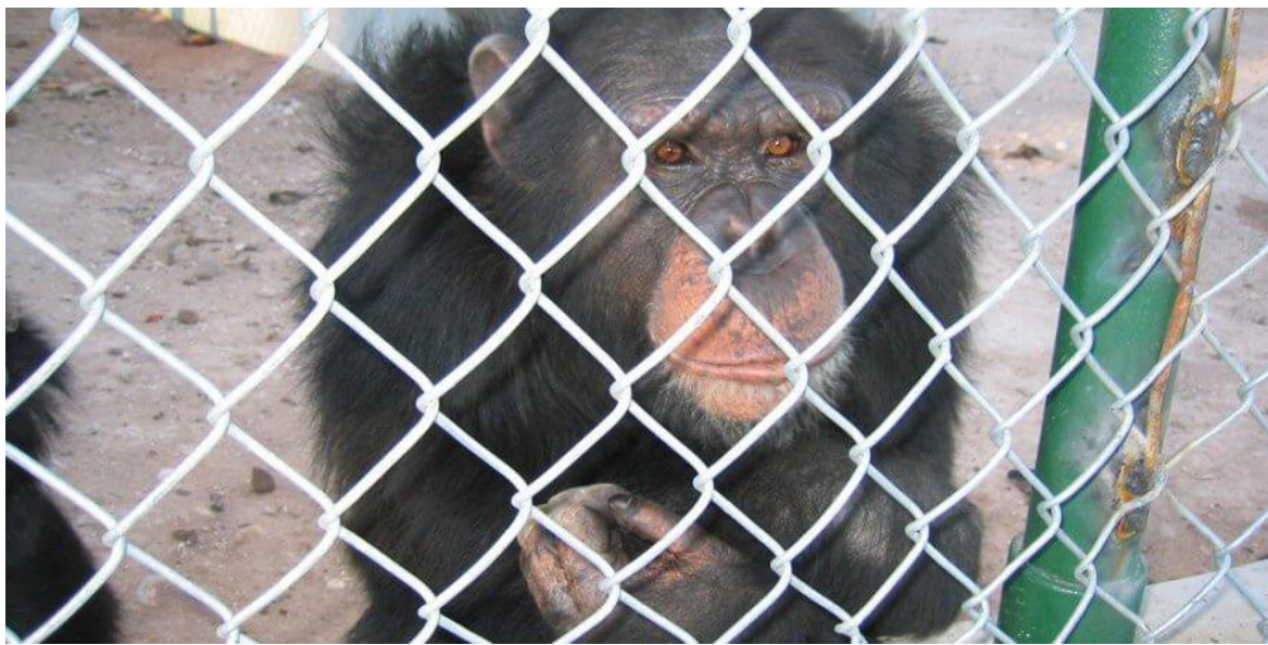
Obrázek 1 Šimpanz Chubbs v útulku Amarillo Wildlife Refuge

Například Chubbs, šimpanz, který hrál ve filmu Tima Burtona Planeta opic , v současnosti žije v texaském zchátralém útulku Amarillo Wildlife Refuge. Organizace PETA ho objevila v nehygienické kleci, kde jedl psí žrádlo a shnilé ovoce. „Zatímco lidé mohou vést bohatý život v přepychu díky natáčení filmů, zvířata, za jejichž vykořisťování jsou zodpovědní, jsou zavržena a zapomenuta.“ 12