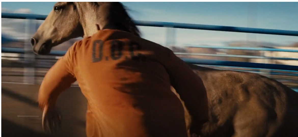
Obrázek 8 Scéna, kde hlavní herec udeří koně pěstí

kaskadér se choval, jako by koně sporadicky udeřil, ale údery nedopadly. Kůň vypadal klidně a ve skutečnosti jen spontánně následoval trenéra kolem ohrady bez známek strachu nebo rozrušení. Byly také natočeny těsné záběry, na nichž se herec oháněl tyčí z PVC nebo prudce vyrážel rány pěstí, jako by koně udeřil. V tomto záběru se žádný kůň nevyskytoval. Herec pouze předstíral, že kůň stojí před ním.