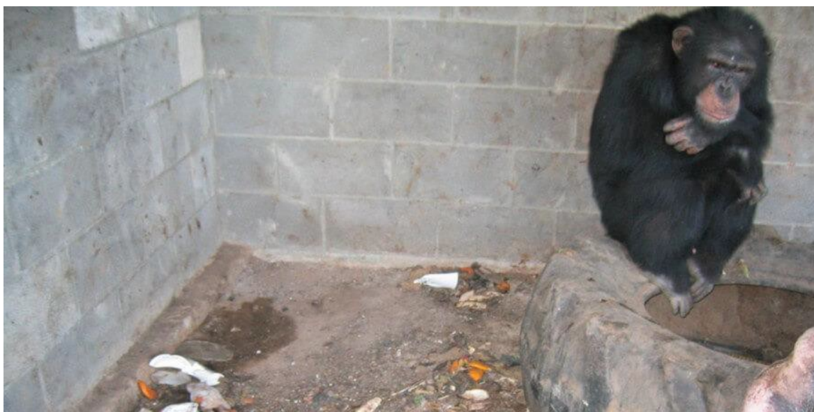
Obrázek 2 Děsivé podmínky ubikace, v kterých šimpanz Chubbs přežívá