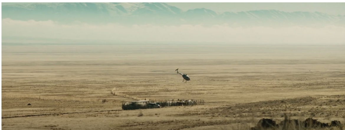
Obrázek 5 Stádo mustangů v ohradě

Ve scéně, kdy se hlavní herec blíží ke koni v uzavřeném přívěsu, se kůň otočí zadkem směrem k herci. Kůň také kývne hlavou, sáhne tlapou na zem a ustoupí od herce. Všechny tyto akce byly vizuálně signalizovány trenérem, který v každé ruce držel dlouhý bič a různě jimi mával nebo je zvedal, aby naznačil různé akce.