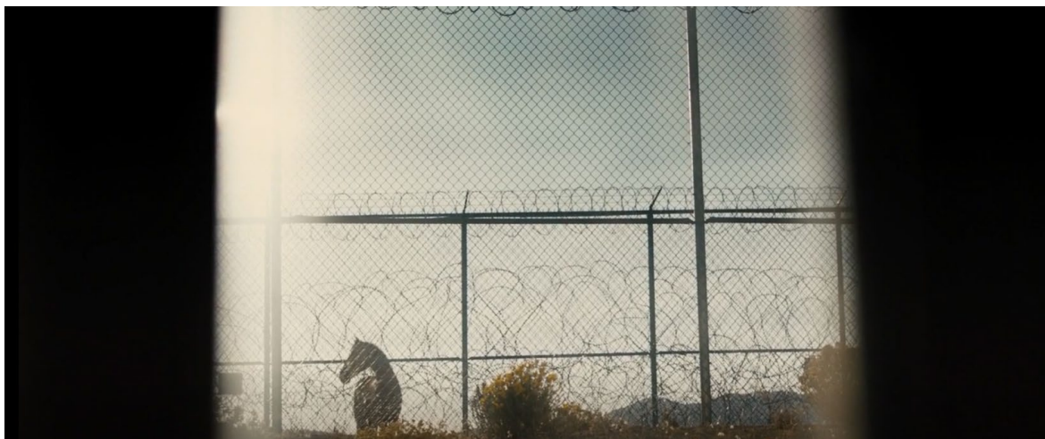
Obrázek 11 Závěrečná scéna

V závěru filmu, kdy herec otevře bránu a kůň vyběhne ven, se tato scéna zkoušela několikrát. Herec a kůň se v tomto okamžiku dobře znali. Cvičitel stál mimo kameru a pokynul koni, aby k němu přiběhl.