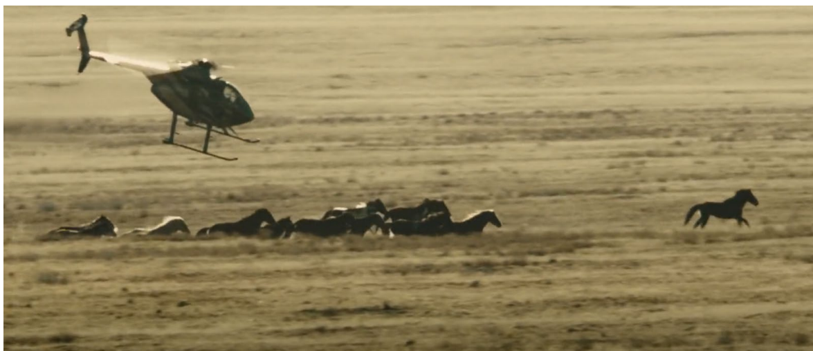
Obrázek 4 Úvodní sekvence filmu

Úvodní záběry na rangery, kteří v poušti nahání divoké koně, byly převzaty z dokumentárních záběrů. Při natáčení těchto záběrů nebylo ublíženo žádnému zvířeti.